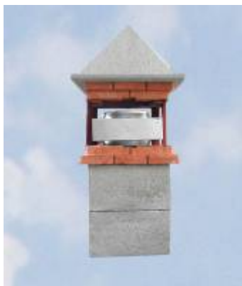
Fase E ( Vista con semitelaio part. 3 smontato )