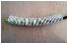
Cuffia di protezione spazzola