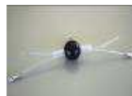
RRFAC1 RIPPER FILO ACCIAIO